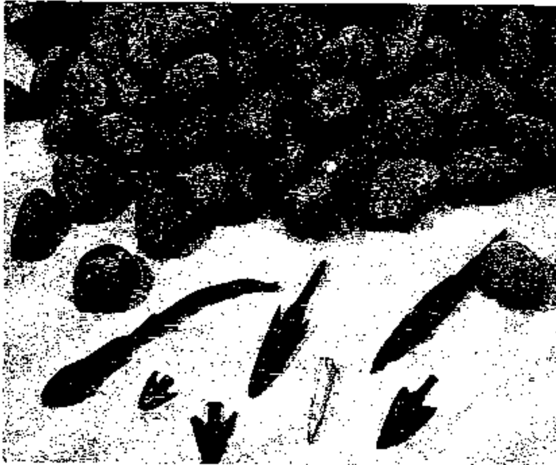
Foto 4: Savaşın En Önemli Kanıtları: Sapan Taşları ve Mızrak Uçları.

dar sokaklarından geçmek ve kentin sağlam surlarına ulaşmak zorundadır. Bu durum yukarı kentte neden çok fazla mızrak ucu bulunmadığını da izah etmektedir. Çünkü kale, çağının uzun menzilli silahı olan mızrakların menzili (100m) dışındadır. Fakat aşağı kentte tunç mızrak uçları ve kilden sapan taşları bulunmuştur. Ayrıca güney kapısı yanında bir ev içinde sapan taşı yığını bulunmuştur. İçeride kil sapan taşlarının sıcakta sertleşmesi için yakılan bir ocak bulunmaktadır. Burası "silah deposu" olarak adlandırılmıştır. Müzelere konan tunç çağının silahları olan mızrak uçları ve sapan taşları da Troya savaşının silahları olarak savaş turizmi için önemlidir (Foto 4). Troya kentinde destanda anlatılan Priamos'un sarayının alt taş duvarları da Akropolis'te yer almaktadır.