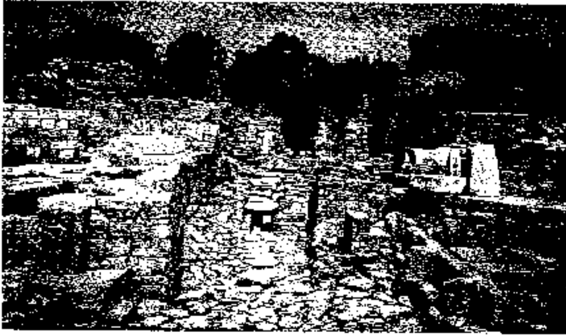
Foto 3: Kentin Güney Kapısı, Taş Döşeli Yol ve Kule'nin Kalıntıları

dar sokaklarından geçmek ve kentin sağlam surlarına ulaşmak zorundadır. Bu durum yukarı kentte neden çok fazla mızrak ucu bulunmadığını da izah etmektedir. Çünkü kale, çağının uzun menzilli silahı olan mızrakların menzili (100m) dışındadır. Fakat aşağı kentte tunç mızrak uçları ve kilden sapan taşları bulunmuştur. Ayrıca güney kapısı yanında bir ev içinde sapan taşı yığını bulunmuştur. İçeride kil sapan taşlarının sıcakta sertleşmesi için yakılan bir ocak bulunmaktadır. Burası "silah deposu" olarak adlandırılmıştır. Müzelere konan tunç çağının silahları olan mızrak uçları ve sapan taşları da Troya savaşının silahları olarak savaş turizmi için önemlidir (Foto 4). Troya kentinde destanda anlatılan Priamos'un sarayının alt taş duvarları da Akropolis'te yer almaktadır.